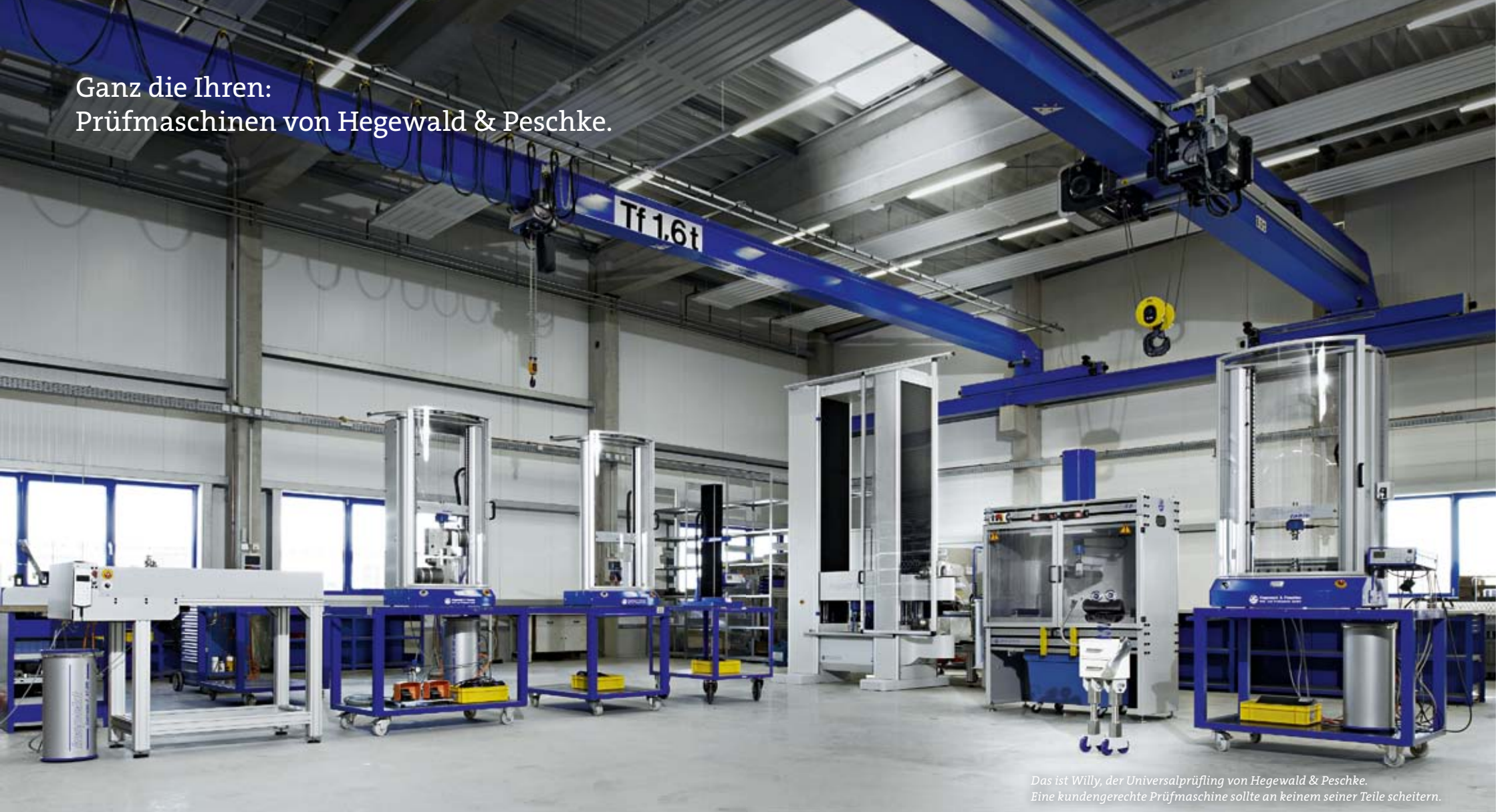
Das ist Willy, der Universalprüfling von Hegewald & Peschke. Eine kundengerechte Prüfmaschine sollte an keinem seiner Teile scheitern.

Jedes Produkt ist individuell – und so auch der Wunsch, es auf Herz und Nieren zu prüfen. Was der Individualität Grenzen setzt, sind die Prüfmaschinen. Standardisierung auf