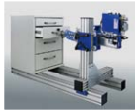
Dieses Möbel-Prüffeld führt Dauerbelastungstests an Schubladen, Auszügen und Funktionsbeschlägen aus.

zu prüfen ist. Hegewald & Peschke bietet modular aufgebaute Möbel-Prüffelder mit pneumatischen oder hydraulischen Aktuatoren. Sie kapitulieren vor keinem Tisch, Stuhl oder Schrank. Die speziell für die Bauteil- und Erzeugnisprüfung entwickelte Prüfsoftware LabControl sorgt dafür, dass die tägliche Prüfaufgabe nicht zur Wissenschaft wird.